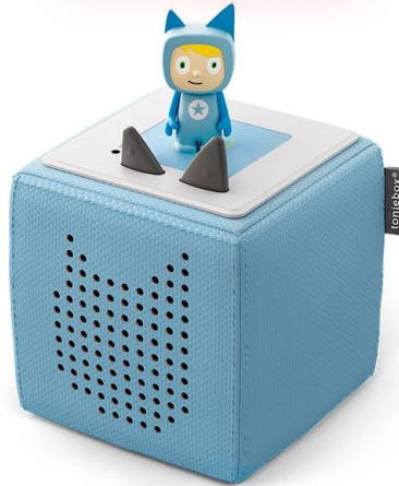
TONIE-BOX, GESPONSERT VON ZIERLEYN NORDHORN