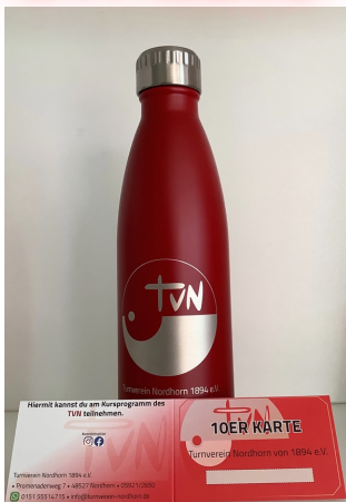
TVN TRINKFLASCHE + 10ER KARTE