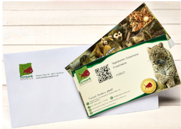
TIERPARK-GUTSCHEIN IM WERT VON 15€